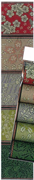
ベストセレクト⑥花柄