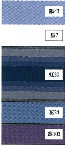
ベストセレクト②青