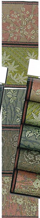
ベストセレクト⑦花柄