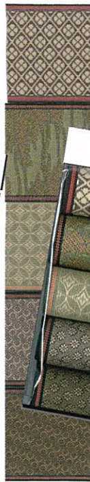
ベストセレクト⑧茶系柄