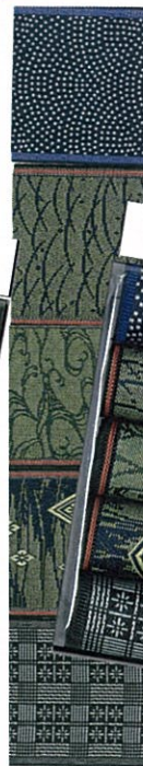
ベストセレクト⑨黒系柄