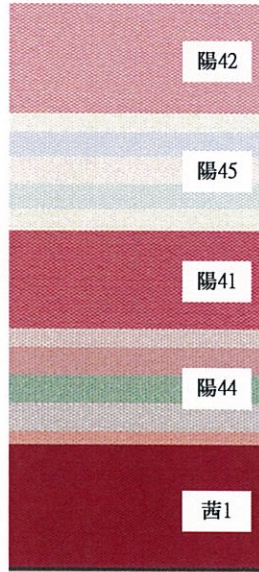
ベストセレクト③赤