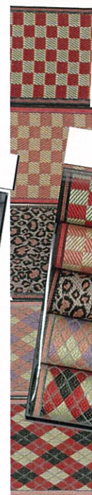
ベストセレクト⑩赤系柄