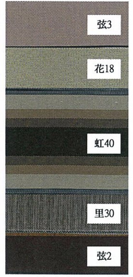
ベストセレクト⑤茶